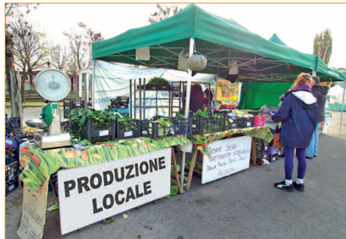
Il mercato dei produttori agricoli a chilometri 0

olio, pane e prodotti da forno. In vendita soltanto prodotti legati alla stagione e provenienti dalle aziende agroalimentari del territorio. Un punto di contatto fra l'esigenza dei consumatori di acquistare prodotti genuini a prezzi contenuti (le merci non sono gravate da costi di distribuzione e di trasporto) e la volontà delle aziende agroalimentari del territorio di farsi conoscere e vendere direttamente la loro produzione.