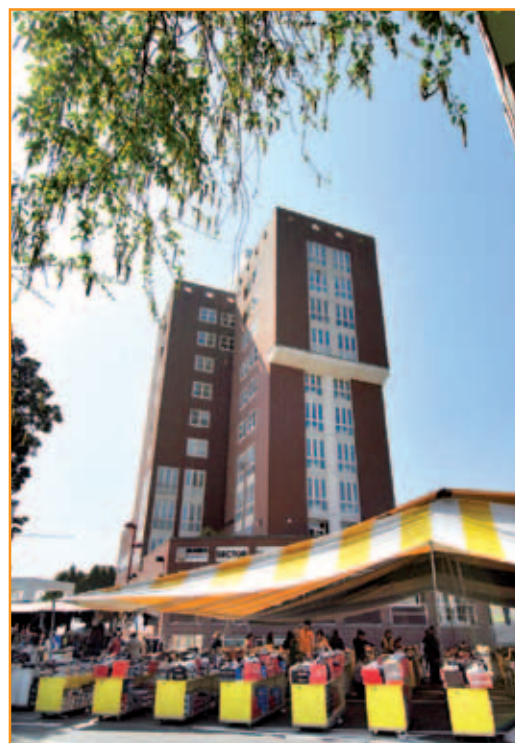
Il grande mercato del sabato

Si svolge ogni martedì mattina in Piazza della Repubblica a Mejaniga. È gestito dalla Cia (Confederazione Italiana Agricoltori) e conta attualmente una dozzina di produttori specializzati in ortofrutta, piante e fiori, miele, formaggi, vino,